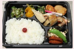
地域食材を使ったお弁当付き